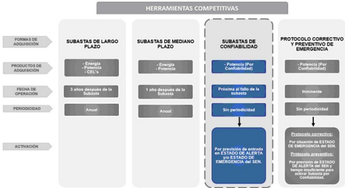
Figura 2.1 Herramientas de adquisición de Potencia

En la Figura 2.1 se muestran las herramientas de adquisición de Potencia.